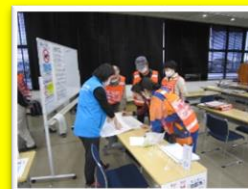
避難所設置、説明資料の準備