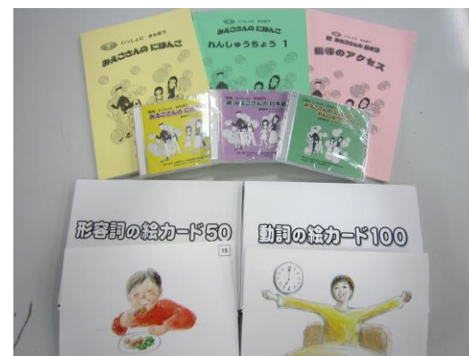
【Série 『Mieko-san no Nihongo』】 Imprimimos aproximadamente 1,500 livros por ano