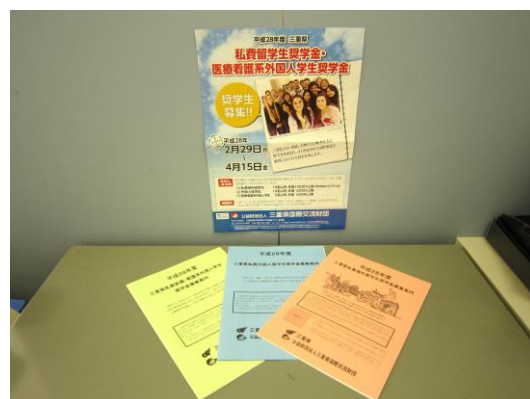
【Bolsa de estudos】

※ 出身など と ひとりひとり たが 互いのことばや習慣のちがいを 認め合い、 尊重し合いながら共存すること