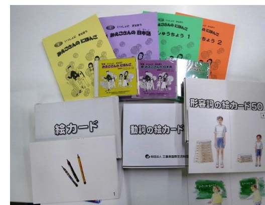
【Série 『Mieko-san no Nihongo』】

Para que a língua japonesa possa ser ensinada de forma simples, desenvolvemos a coleção de livros 『Mieko-san no Nihongo』 . Estes estão sendo utilizados nas creches e escolas da província. Além disso, temos um Centro de Educação Multicultural chamado 「Mi-ku」 que fornece livros e materiais didáticos.