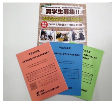
【Foreign Students Scholarship】▶

Sa pakikipagtulungan ng gobyerno ng Prepektura ng Mie, ang MIEF ay nagbibigay ng “scholarships” para sa local na residente na ibig mag-aral sa ibang bansa. Gayundin, ang pag-imbata sa mga nagtuturo ng wikang hapon sa ibang bansa upang mapalawak ang kanilang kaalaman.