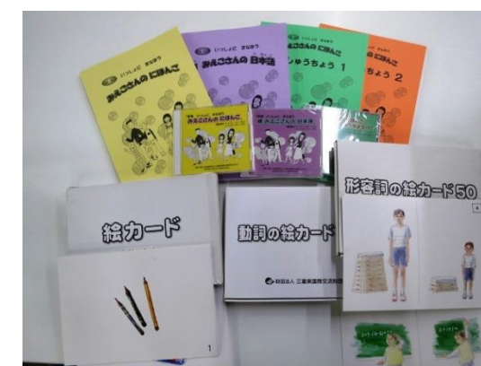
▲『Mieko san no Nihongo』Series

Bilang layunin na makatulong sa mga tagapagturo ng wikang hapon para sa mga dayuhan, kami ay lumikha ng orihinal na seryang aklat-aralin 『Mieko san no Nihongo』 at ito ay pinamamahagi sa mga publikong pampaaralan sa Mie. Kami rin ay nagbukas ng multi-cultural education center na tinatawag na 「Mi-ku」 kung saan may mga libro tungkol sa pagtuturo ng Nihongo at iba pa.