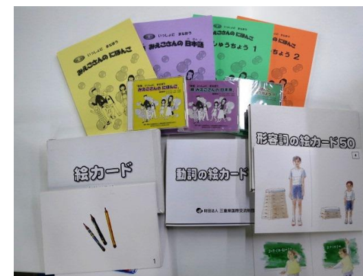
『三重孩子的日语系列』

为了能够通俗易懂地教授跟外国有关联的孩子们日语，我们开发了教材「 三重孩子的日语系列 」这本教材被县内的幼儿园·学校所使用。另外，多文化共生教育中心运营着「みーく」，提供图书·教材等。