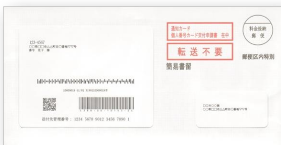
[Cartão de Notificação ( Tsūchi Card )