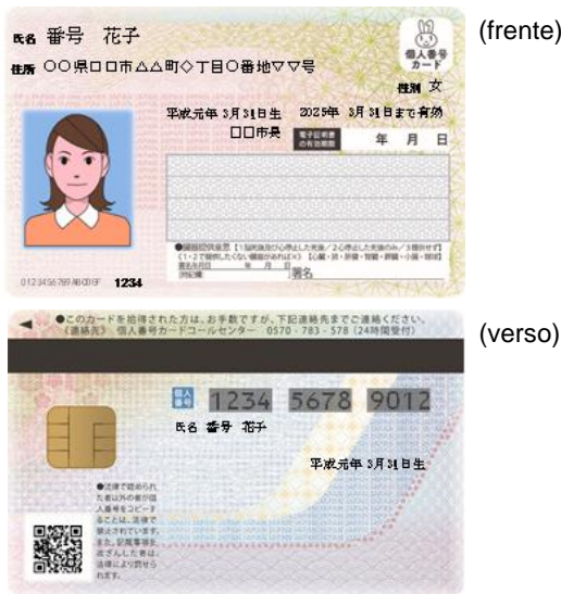
[Cartão com o Número Individual ( Kojin Bangō Card )]